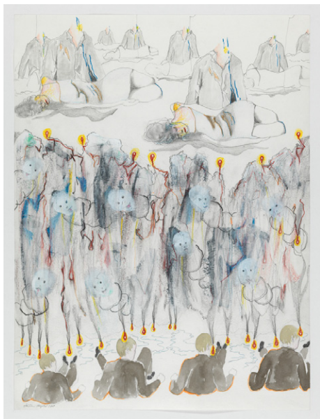
Christian LHOPITAL, #8 de la série Tout va bien , 2007.

8 janvier - 4 février 2020 Albert - lycée lamarck