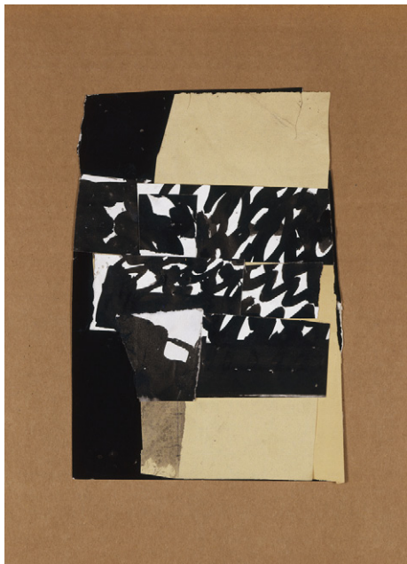
Pierrette BLOCH, Sans titre , 1971.