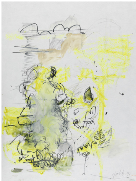
chantalpetit, Sans titre de la série Hölder Nil, 1997.