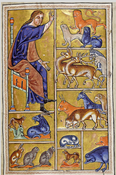
Page du Bestiaire d'Aberdeen , XII ème siècle

On appelle "bestiaire" un ouvrage du Moyen Âge qui regroupe des récits et des fables consacrés aux animaux. Attention ! Ne croyez pas qu'il s'agisse d'un livre scientifique. On y retrouve aussi bien des chiens, des éléphants que des dragons ! Cette tradition était très à la mode au XII ème et au XIII ème siècles en France et en Angleterre. Ces manuscrits sont richement illustrés de miniatures où des animaux chamarrés font souvent face au Christ.