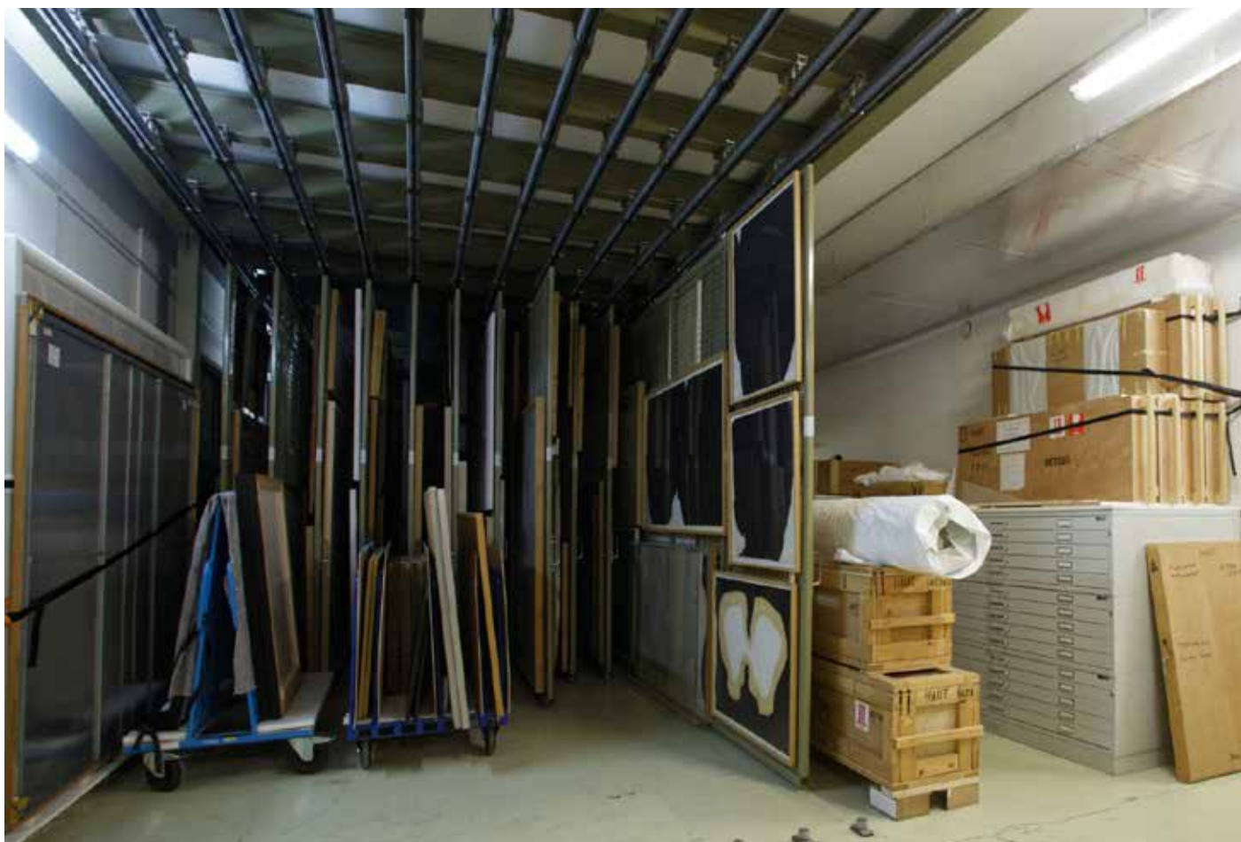
Vue des réserves du Frac Picardie

Ce dispositif propose aux établissements scolaires du sud de la région des Hauts-de-France d'accueillir gratuitement une œuvre de la collection du Frac Picardie pour accompagner la mise en place du Parcours d'éducation artistique et culturelle grâce à la découverte d'un.e artiste et de sa démarche.