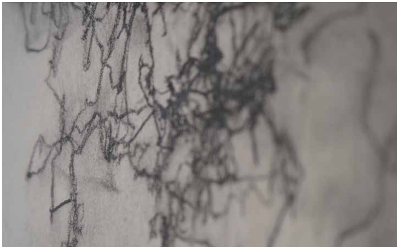
Détail d'une création d'élève lors du Workshop avec Emmanuel Beranger

Conception avec l'équipe éducative d'une exposition autour de la nature et du végétal dans la galerie du lycée, ainsi que d'un programme de rencontres avec l'artiste.