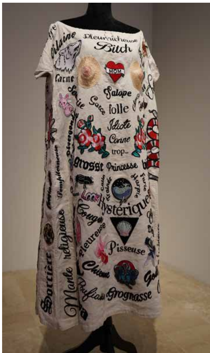
Céline Tuloup, Bashing , 2021

→ Comment postuler ? Les établissements souhaitant construire un projet avec le Frac doivent répondre à l'appel à participation. Un jury, constitué de membres de l'équipe du Frac, de membres de l'Éducation nationale et d'artistes, sélectionnera les projets retenus en fonction de leur ancrage territorial, des thématiques ciblées et de l'intégration du projet à la vie de l'établissement.