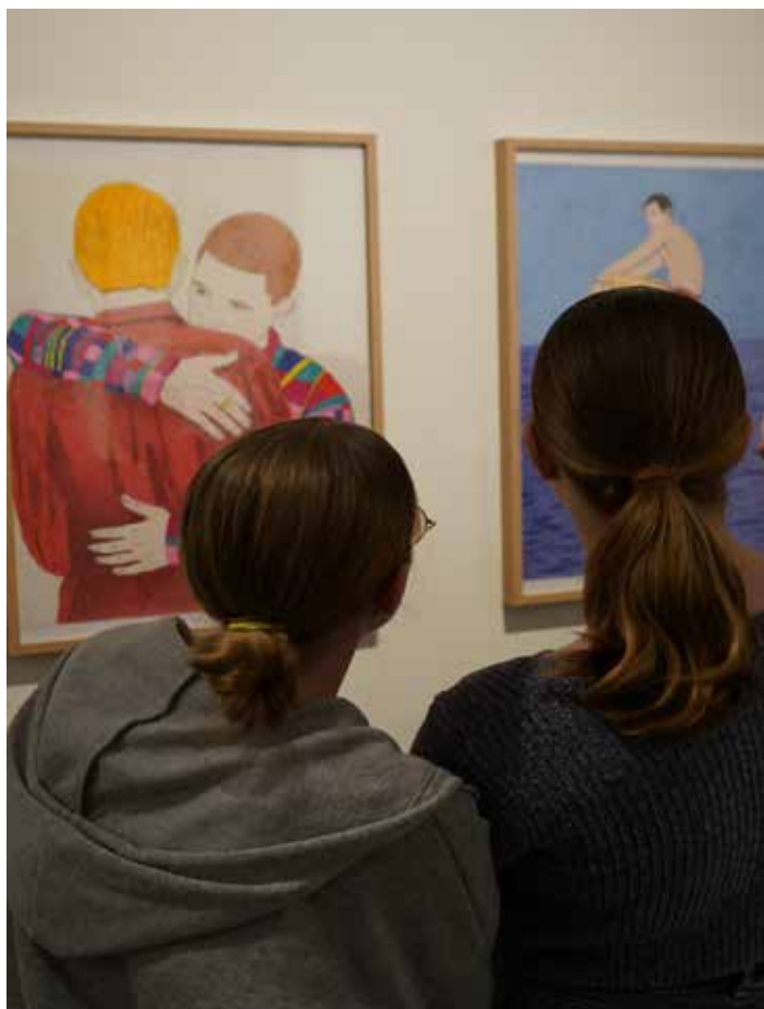
Vue de l'exposition "Voyage, voyage", Collège Ferdinand Buisson

⊙ Qui postuler ? Pour tous renseignements, vous pouvez nous contacter à l'adresse suivante : public@frac-picardie.org