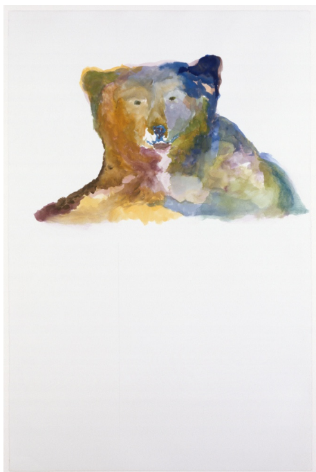
Anne CHU, Untitled (Bear Head) [Sans titre (tête d'ours)] , 1996.

8 novembre - 10 décembre 2018 Hirson - lycée Frédéric et Irène Joliot Curie vanités