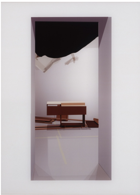
Alain Bublex, Paysage 4 (pendant), 2006.

rencontre découverte de l'exposition pour les responsables de groupes constitués → mardi 21 novembre 2017