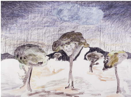
Erik Dietman, Pays Sage, 1993.

8 novembre - 11 décembre 2017 Chantilly lycées jean rostand et de la forêt traverser